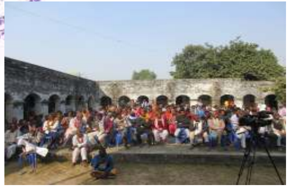
धनुषाधाम नगरपालिकाको चौथो नगर परिषदमा उपस्थित महानुभावहरु