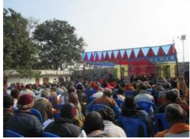
चौथो नगरपरिषदका भलकहरु